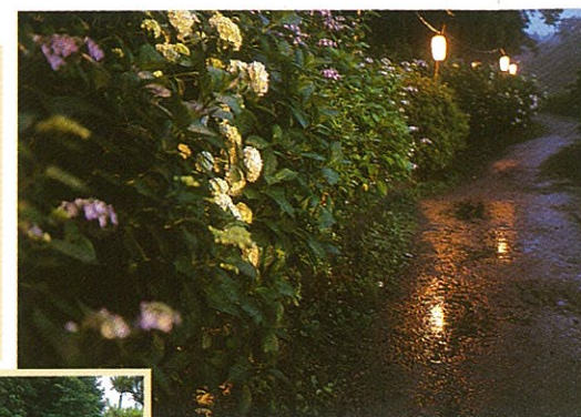
あじさいまつりの期間ライトアップ