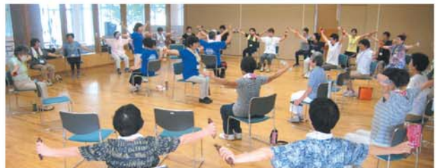
1月のシニア筋力ぐんぐん教室日程