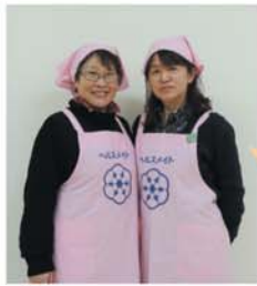
今月の 食生活改善推進員さん