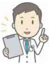
健康診査等の種類・実施方法など