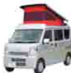
軽キャンピングカーKONG

A. キャンピングカーと聞くと敷居の高いイメージがあるかもしれませんが、今は、軽自動車サイズのキャンピングカーもあります。弊社では体験宿泊もできますので、身構えずに、お気軽にご相談ください。