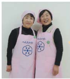
今月の 食生活改善推進員さん

エネルギー122kcal、炭水化物15.6g、食塩相当量0.6g 〈今より4gの減塩で、食塩摂取は1日8gに!〉