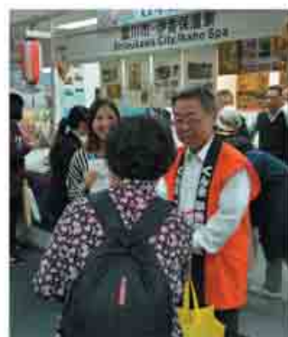
トップセールスで渋川をPR

この旅行博には、68の国・地域から950団体が出展し、期間中約37万人が来場した中、商談やパンフレットの配布を行いました。途中、友好協力協定締結のため台湾訪問中の市長も参加し、渋川市と伊香保温泉の魅力発信のためトップセールスを