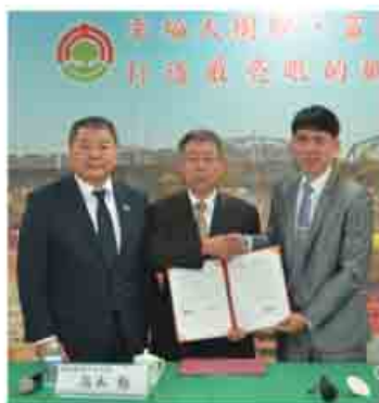
大樹区での協定調印式

平成4年から旧北橋村で、中学生の海外派遣を実施。以後、現在も毎年夏休みに中学生の海外派遣を行っているほか、本年11月には市長およびファカタネ高校生徒など約30人が来市しました。