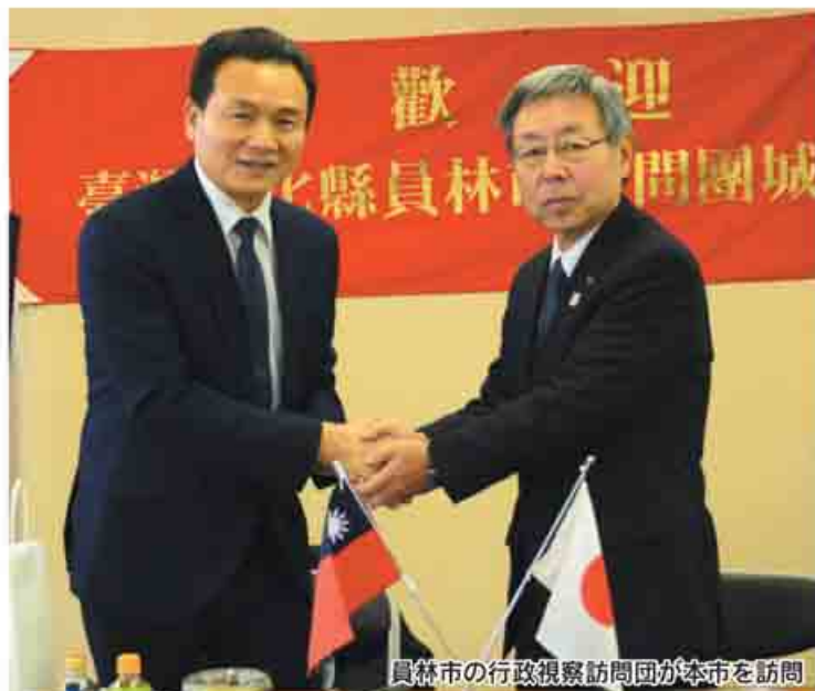
員林市の行政視察訪問団が本市を訪問

近年の外国人観光客の増加に伴い、本市でも台湾や中国からの観光客が増加しています。そのような中、本市では、交流人口の拡大や観光振興を目的に、台湾の3自治体と友好協力協定を締結しました。これらの経緯や、友好協力協定を締結した自治体を紹介します。