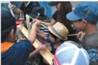
流しそうめん大会

保護者が学校の玄関先で登校する子どもたちにあじさいを交わす取り組みや、中学生が小学校を訪問してあじさい運動を行う実践を通して、子どもたちは心を込めてあじさいができるようになってきています。また、地域のお父さんが中心となつて協力し、子どもたちの笑顔のために手作りの流しそうめん大会を開催しました。親子の心が触れ合うすてきなひとときとなりました。