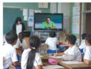
地域の方の授業参加

金島小学校では、金井地区の皆さんの協力を得て、児童の安全確保のために通学路の要所でパトロールを実施していただいています。通学時の危険箇所などの情報も随時いただき、関係機関と迅速に対応することができました。また、6月には社会科研究授業で地域の人にビデオ出演もしていただきました。地域の皆さんの配慮と指導に、児童とともに感謝しています。