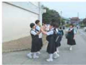
あいさつ運動の取り組み

あいさつ運動を通して子どもたちの公心や社会性を育成することがわらいます。ハイタッチ活動を取り入れるなど、各学校での積極的な取り組みはもとより、中学校の生徒会と小学校の児童会が連携したあいさつ運動も行っています。