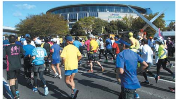
前橋・渋川シティマラソンのエントリー種目・参加料一覧