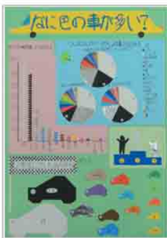
統計グラフコンクール 〈第1部最優秀賞〉