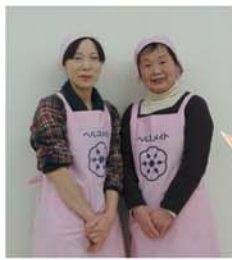
今月の食生活改善推進員さん