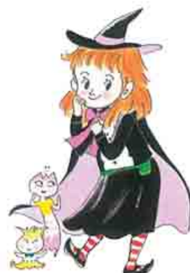
(C)藤真知子・ゆーちみえこ・ポプラ社