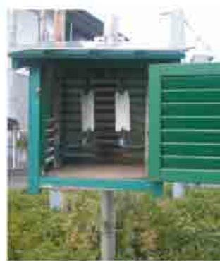
アルカリろ紙百葉箱

ています。ふっ素イオンは、工場から排出される物質に含まれるもので、工業地帯はその影響が考えられ、やや高い値で推移しています。