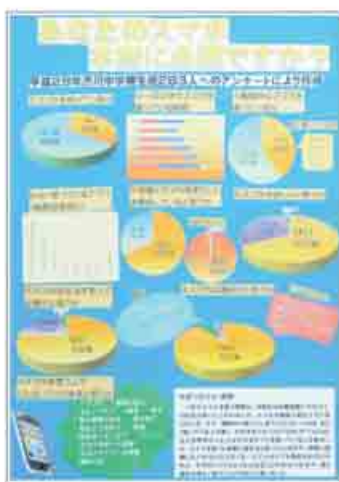
統計グラフコンクール (パソコン統計グラフの部最優秀賞)