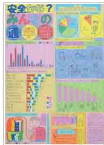
統計グラフコンクール (第2部最優秀賞)