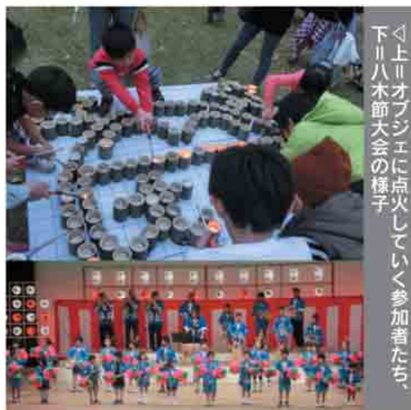
下↑上↑オブジェに点火していく参加者たち、 下↑八木節大会の様子

とき ▷21日(土)=午後3時30分から ▷22日(日)=午前11時30分から ところ ▷21日=北橋行政センター中庭 ▷22日=北橋公民館 内容 北橋地内で作った竹炭を無料で配布します(数に限りがあります)