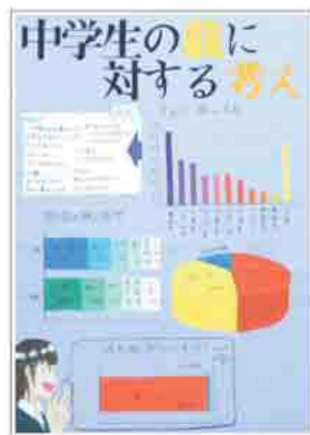
統計グラフコンクール (第4部最優秀賞)