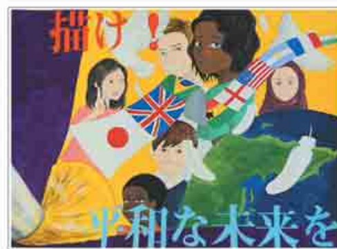
平和推進啓発ポスターコンクール 〈最優秀賞〉