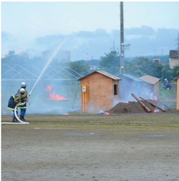
9/2 北橘総合グラウンドで「群馬県総合防災訓練」が開催されました。