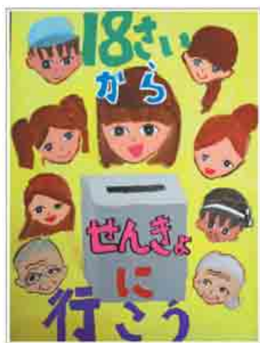
選挙啓発ポスターコンクール (委員長賞)