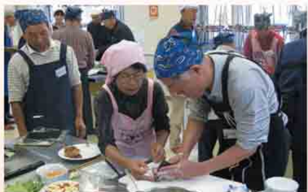
アドバイスを受け、料理を楽しむ参加者

申・問 電話か直接市保健センター(☎251321)、または各地区の食生活改善推進員へ 期 10月5日(木)～16日(月) ※土・日曜日、祝日を除く午前8時30分～午後5時15分。