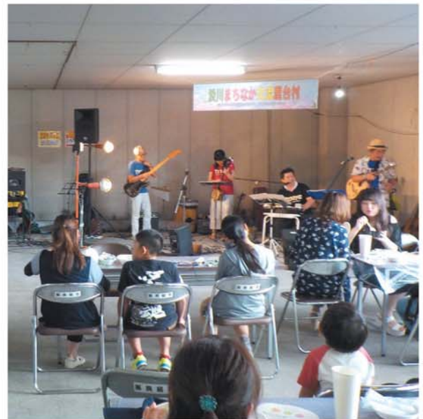
9/3 渋川地区で「渋川まちなか交流屋台村」が開催されました。