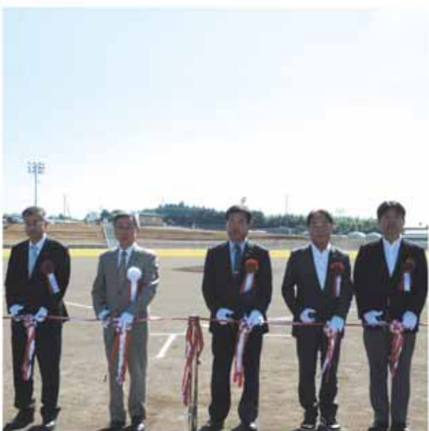
北橋地区で「北橋運動場野球場開場式」が行われました。

5回にわたり紹介してきた「ぐんま元気(GENKI)の5か条」は、県民の皆さんが元気にいきいきと生きるために取り組んでほしいことが書いてあります。健康づくりに生かしてください。