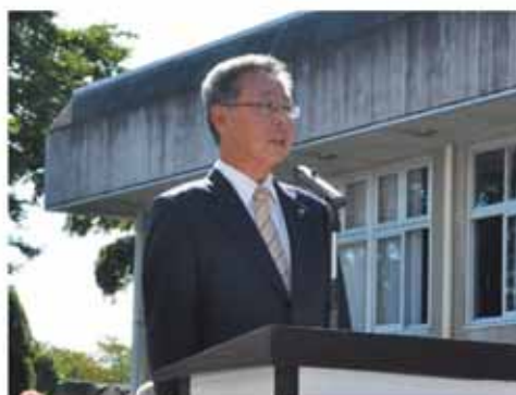
【10月13日市長就任式でのあいさつ】

結果が出なくても使命感をもって全力で取り組む「とにかく市民のために一所懸命仕事をしてほしい」そんな思いを込めて、「三振を恐れず思い切ってバット振ってほしい」と職員に話しました。これからも、渋川市の発展と8万市民の幸せのために日々全力で公務にあたっています。