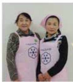
今月の食生活改善推進員さん

エネルギー198cal、食物繊維1.8g、食塩相当量0.8g (今より4gの減塩で、食塩摂取は1日8gに!)