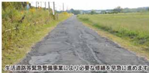
生活道路等緊急整備事業により必要な修繕を早急に進めます