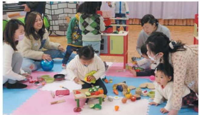
子育てサロンの様子