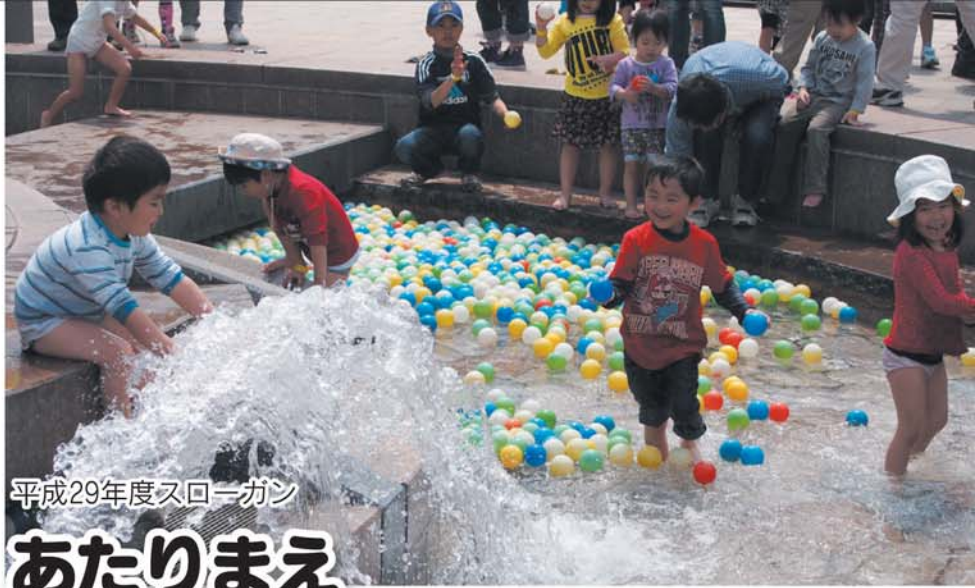
平成29年度スローガン

第59回全国水道週間に合わせ、市が行っている安全で安心な水道水の供給に対する取り組みや、水道に関するお知らせを紹介します。