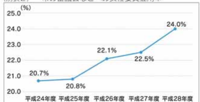
(別表2) 市の審議会などへの女性委員登用率