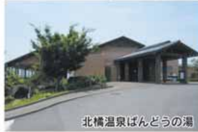
北橋温泉ばんどうの湯