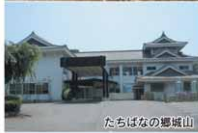
たちばなの郷城山