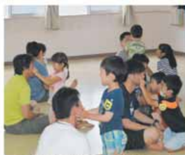
男性向け講座(パパとあそぼう)