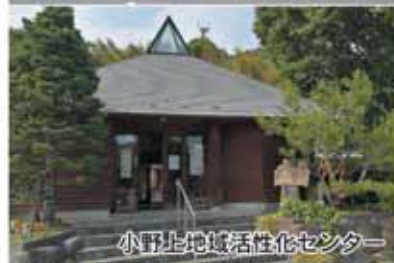
小野上地域活性化センター