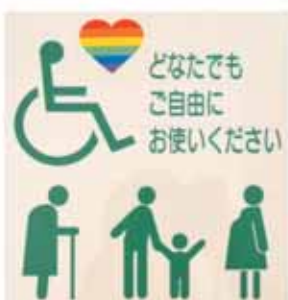
第二庁舎2階東側誰でもトイレの表示