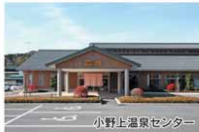
小野上温泉センター