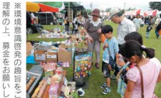
※環境意識啓発の趣旨をご理解の上、募金をお願いいたします。

介護で悩んでいる人、虐待や虐待の疑いに気付いた人は、地域包括支援センターへ相談してください。連絡した人の名前が周囲に漏れることはありません。 問 ▷本地域包括支援センター(担当地区:渋川・伊香保)=電22179 ▷子持地域包括支援センター(担当地区:小野上・子持)=電5445 ▷赤城地域包括支援センター(担当地区:赤城・北構)=電6002