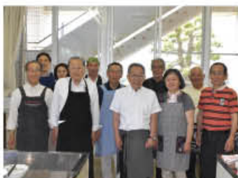
たちばな支援の会のみなさん

たちばな支援の会では、「ワイワイガヤガヤ」をキーワードに、地域の多様なメンバーが、今やっていること、無理なくできることを話し合っています。