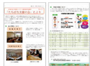
たちばな支援の会たより