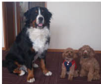
キング (8才) クロエ (8才) チョコ (8才)