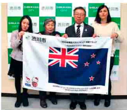
応援フラッグを掲げてみんなで記念撮影

市長 本日はありがとうございます。私は、オリンピック・パラリンピックを契機に、レガシー（遺産）を残していきたいと思っています。子どもから高齢者まで、また、障害のある人や外国出身の人などが、世代や国籍を超えて交流できる場が身近にあり、そこに人が集まって、お茶を飲んだりお祭りなどを楽しんでいければよいですね。また、多くの人に渋川を訪れてもらい、市民の皆さんと多文化交流していたとき、渋川市を共生の都市にしていきたいと思っています。