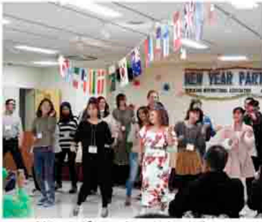
外国のダンスをみんなで踊る