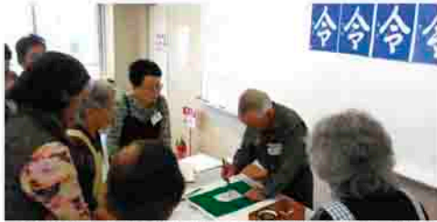
今年度行われた「はじめての蠟書(ろうしょ)入門」