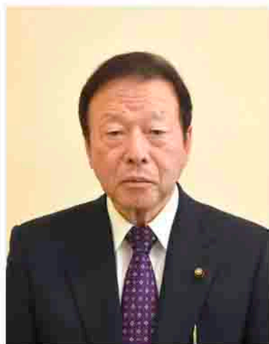
渋川市議会議長 石倉 一夫

明けましておめでとございます。年頭に当たり、市民の皆さまに謹んで新年のごあいさつを申し上げます。皆さまには、日ごろから市議会に対する温かいご理解とご協力を賜り、厚くお礼申し上げます。