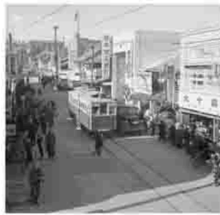
市内を走っていた路面電車

崎、前橋、沼田および中之条行きの5路線で、生活や観光の足として活躍した路面電車などの写真や関連資料を展示するイベントを開催します。 〈本庁舎記憶展〉 とき 1月14日(火)～24日(金)午前8時30分～午後5時15分(市役所閉庁日も開催) ※14日は開催セレモニーを行うため午後0時15分から ところ 1階市民ホール 〈第二庁舎記憶展〉 とき 1月27日(月)～31日(金)午前8時30分～午後5時15分 ところ 2階あじさいサロン 問合せ先 生涯学習課(☎22)2500)