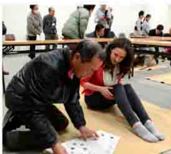
外国人への支援の方法を学びます

とき 2月5日、12日、19日、26日の午後7時～9時(いずれも水曜日・全4回) ところ 市役所第二庁舎203会議室 内容 ▽避難所運営訓練(図上・実技)