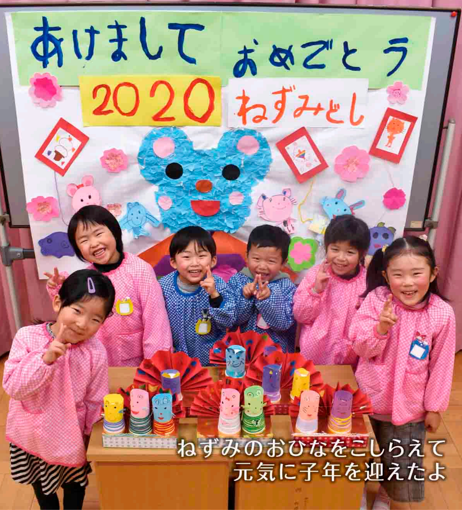
ねずみのおひなをこしらえて 元気に子年を迎えたよ