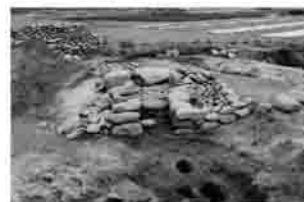
白井尖野遺跡1号古墳の横穴式石室