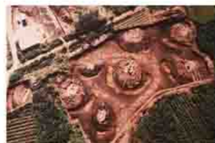
6世紀末に始まる北橘地区水泉寺古墳群