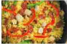
ヴァレンシアーナ

とき 3月7日(土)午前10時～午後1時30分 ところ 中央公民館 内容 次の料理を作ります