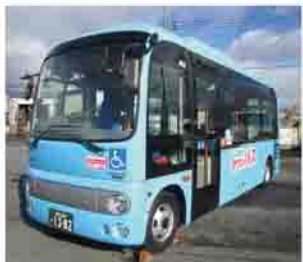
国土交通省認定のノンステップバス

新しい車両は、スロープを完備したノンステップバスで、車いすでも安心して乗車できます。