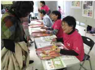
食育推進活動の様子

食育基本法で「食育アドバイザー」とも称されるヘルスマイトは、渋川市健康増進計画(健康プランしぶかわ21)でも地域における食育推進の担い手として活躍が期待されています。計画の目標である「世代に応じた食育と栄養バランスのとれた食生活の実践」「食に関する感謝の念と食文化の継承」の達成を目指し、市民と渋川市の食育推進活動を応援しています。