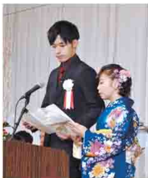
新成人代表による「成人の誓い」