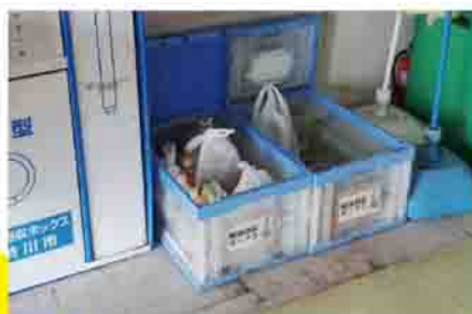
本庁舎などに設置してある廃油回収ボックス

環境に優しい社会の実現へ向け、私たち一人一人が自主的、積極的にバイオマスへの理解を深め、活用に取り組んでいきましょう。