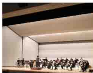
観客席から見た様子