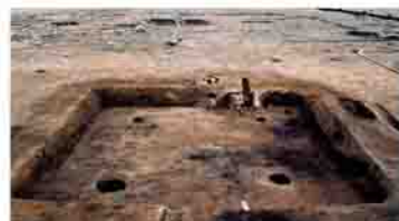
7世紀の有力農民の住居(半田中原南原)

大規模な溜池や水路、地方を結ぶ直線道路もつくられはじめ、大開発の時代が幕を開けます。その開発の担い手となったのは、前回紹介したような、6世紀後半以降急増する群集墳に葬られた有力農民たちでした。