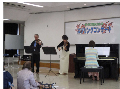
ピアノとヴァイオリンの豊かな音色