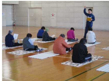
自分の身体と寄り添って

16名が参加し、腹筋、開眼片足立ち、6分間歩行など、全6種目を行いました。結果を踏まえ、強い部分、弱い部分を把握し、今後の身体作りに活かしてもらいたいです。