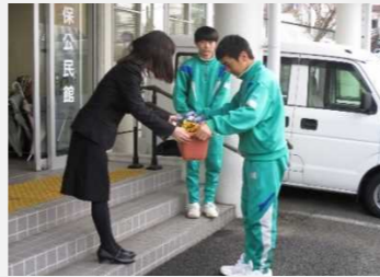
大切にさせていただきます