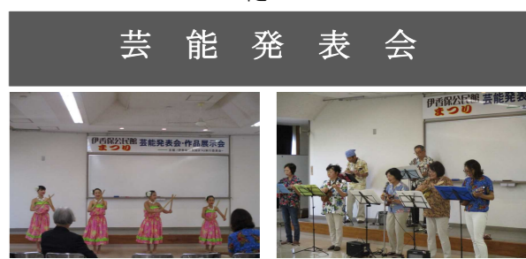
リコレファ・ケイキ