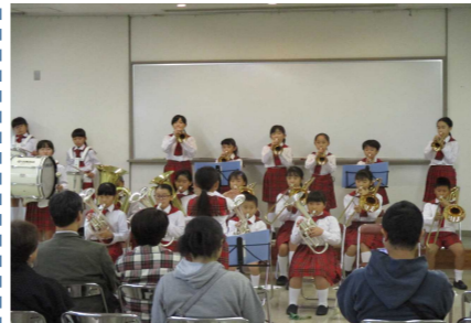
伊香保小学校金管バンド