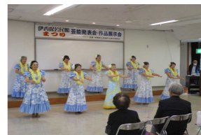
プアレファ伊香保