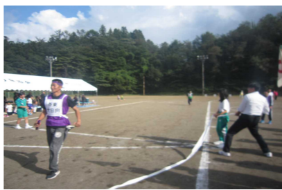
リレーでフィニッシュ!!