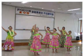
リコレファ伊香保