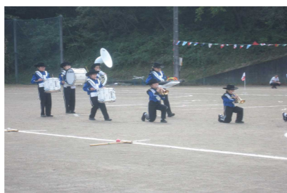
金管バンドマーチング