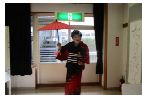
「袋小路ゆきどまり」さん