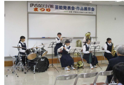
伊香保中学校吹奏楽部