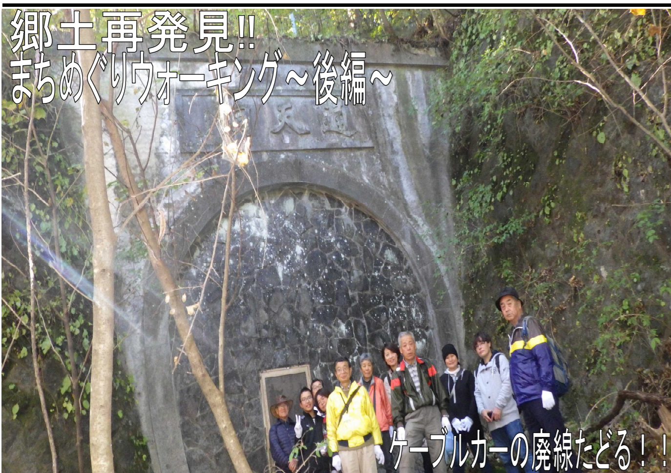
ケーブルカーの廃線たどる!!