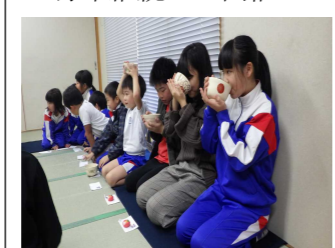
学び取るは、心のあり方

毎年継続して開催しているためか、高学年になればなるほど、大まかな所作を自然とできていました。また、低学年の児童達、特に1年生は、触れる機会が少ない世界に、興味津々の様子でした。お茶や和菓子を楽しむだけでなく、穏やかな心のあり方を学ぶ場となりました。