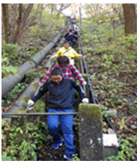
急斜面の階段にヒヤヒヤ

当時の伊香保の先進性や榛名とのつながりを裏付ける貴重な遺産である一方、時代に埋もれ、地元の住民でも存在を知らない、忘れ去られてしまっていた”まじの記憶”を改めてクローズアップしました。