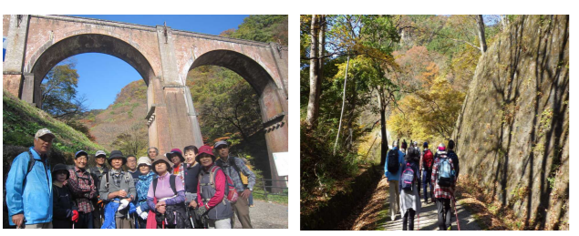
「めがね橋」にて こもれびに抱かれながら

いったところでしたが、楓やイチョウの暖かみのある葉に抱かれながら、ゆつたりと汗を流しながら散策できました。