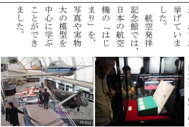
大迫力の展示物 硬貨の歴史を学ぶ

航空発祥記念館では、日本の航空機の「はしまり」を、写真や実物大の模型を中心に学ぶことができました。