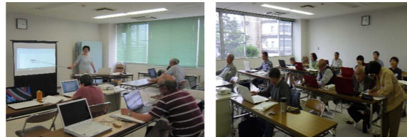
2年前のPC教室の様子。今ではサークルとして活動中！