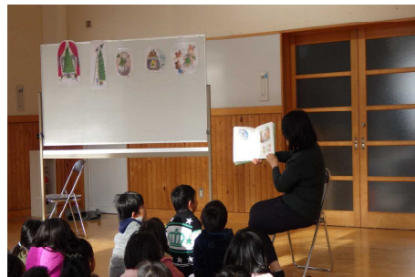
絵本の世界に魅き込まれて

「一年の締めくくり♪世代間交流館クリスマス会」 12月7日(土)に世代間交流館にて、毎年恒例の「クリスマス会」が行われました。 まずは、「ポコ・ア・ポコ」の3人による読み聞かせとヨガを組み合わせたレクリエーションを全員で楽しみました。 こころと身体をほかほかにした後は、お待ちかねのプレゼントタイム。子育てサポーターのみなさんや地域の方々とともに、今年も気の早いサンタが伊香保のまちへやってきました。なかまたちとケーキを頬張りながら、笑顔があふれる一日になりました。