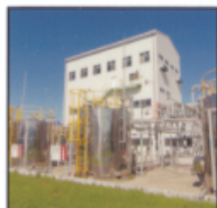
電気二重層キャパシタ用 電解液製造工場

固体電解コンデンサ向け電解質、漂白剤、発炎筒、火薬等は国産トップレベルの製造をしています。