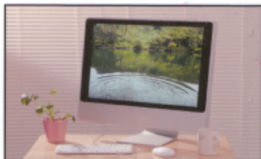
機能性コンデンサ用陰極材料 ポリピロール