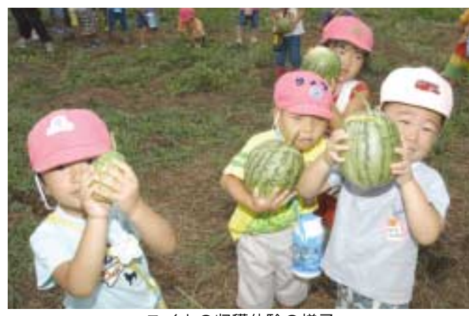
スイカの収穫体験の様子

(3)次世代を担う子供たちに農業についての理解を高めるため、体験学習を通じて教育関係者との懇談や協力者とも連携し