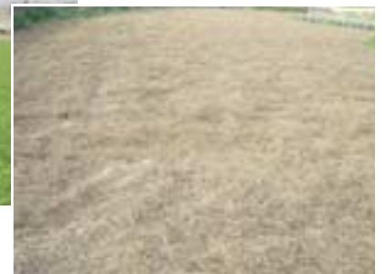
7月～8月 敷糞状になり雑草を抑制

播種及び管理方法など、詳しくは農業委員会事務局(☎22-2920) またはお近くのJA、種苗会社へお問い合わせください。