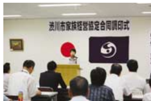
記念講演会の様子