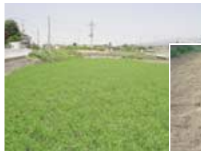
10月～6月 青々として飛砂を防止

農地の様子がわかりますので参考にご覧ください。(場所等詳しくは下記事務局へお問い合わせください)