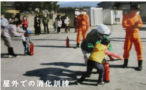
屋外での消火訓練