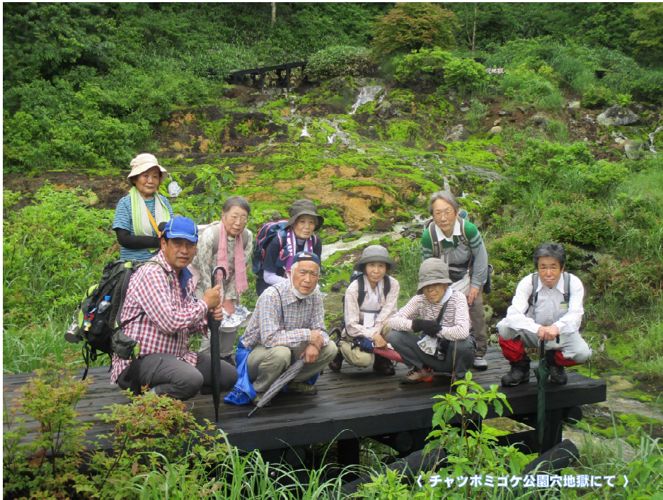
〈チャツボミゴケ公園穴獄にて〉