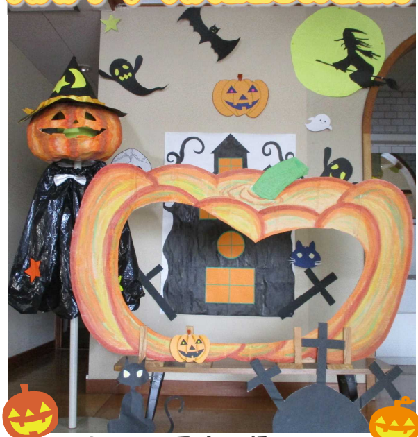
映える(2)写真が撮れます!