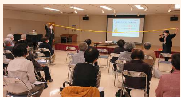
小腸(約6m)の模型を使って説明をするヤクルト販売の方