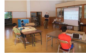
〈8/18 プログラミング教室〉