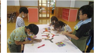
〈8/23 ブーメラン作り教室〉