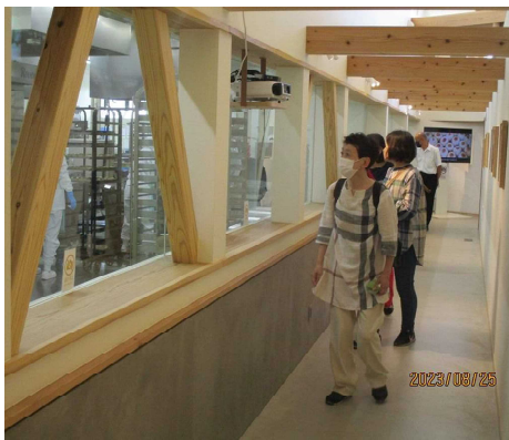
〈OYAKI FARM 工場にて〉

8月25日(金)に成人学級「善光寺・松代象山地下壕・OYAKI FARM」を開催しました。