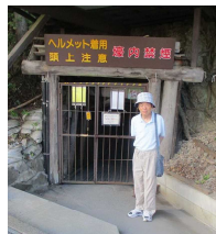
〈松代象山地下壕 入り口にて〉