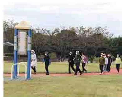
▲赤城健康公園のウォーキングコース

定員 20人(先着順) 持ち物 天候に合わせた動きやすい服装、飲み物、帽子、タオル 申込期間 8月22日(火)~9月1日(金) 申込み・問合せ先 本介護保険課(☎22116)へ 健康遊具の使い方方を動画で確認できます 赤城健康公園にある12種類の健康遊具の使い方動画をで紹介しています。ぜひ、確認してください。