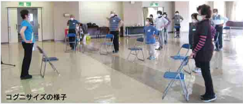
コグニサイズの様子

健康運動指導士による「脳を刺激するコグニサイズ(頭を使いながら運動)」を中心に行いながら、認知症を遠ざける生活習慣などを学習します。「脳活(脳の活性化)に役立つ知識を知りたい」「しっかり体を動かして脳活したい」と思っている人は、ぜひ、参加してください。