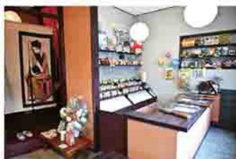
企画・開店支援をした射的居酒屋

地域価値プラスは、観光振興や起業支援など、多方面にコンサルティング業務などを提供し、魅力ある地域づくりに貢献することを目的に活動しています。現在までに、旧渋川市と旧伊香保町の歴史年表作成や、県央・北毛・吾妻の広域をまたいだ観光パンフレットの作成、空き店舗対策として射的居酒屋の企画・開店支援など、行政と住民の仲介をしながら地域の魅力度向上に尽力してきました。