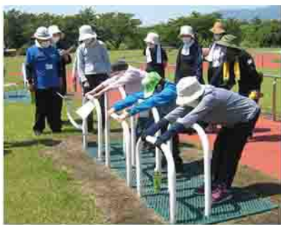
▲ふくらはぎをのばす遊具