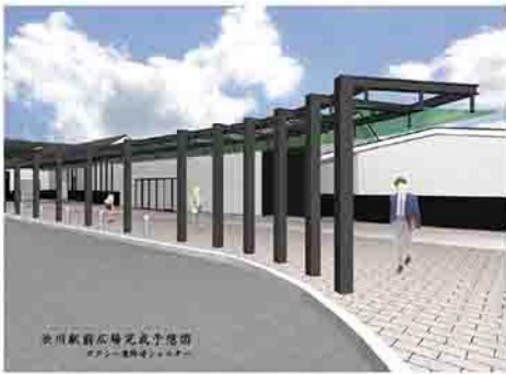
渋川駅前広場元北字役所 タクシー乗降場シエルター