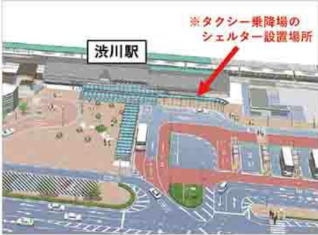
※タクシー乗降場のシエルター設置場所

工事期間 8月下旬ごろ～令和6年3月25日(予定) 施工業者 南澤建設(株) 詳しくは、都市政策課(☎22073)へ。