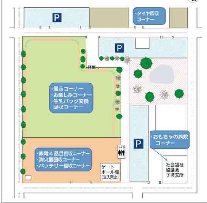
(別図) しぶかわ環境まつり 会場配置図(子持ふれあい公園)