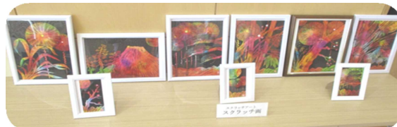
※写真はイメージです。公民館に見本があります。

定員を超えた場合は抽選となります。5月15日(水)以降、結果等を公民館まで必ず確認してください。