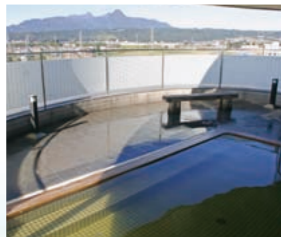
スカイテルメ渋川

Ikaho Onsen offers two kinds of hot springs: golden and silver. The golden kind is actually reddish brown in color, which is the origin of the color of onsen manju (grilled buns). The water color changes due to the iron coming in contact with air and oxidizing. It is good for improving circulation and also known for its holy property to bless couples with newborns. The silver kind is actually clear and feels soft to the skin. Komaguchi (system that divides the flow of hot springs) is situated in Ishidan-gai (a street of stone steps), showing that the same system used 400 years ago to deliver hot springs to inns is used even today.