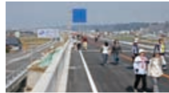
Opening of National Route 17 Maebashi Shibukawa Bypass

In order to solve the chronic traffic jam around Bando Bridge and reinforce the network between Maebashi and Shibukawa, long awaited Maebashi-Shibukawa bypass opened. Many people showed up at the opening ceremony.