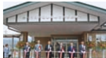
Opening of Akagi Clinic

Akagi North and South Clinics under the National Health Insurance system merged to become Akagi Clinic. In addition to outpatient treatment, house calls and other medical care, the clinic provides physical checkups.