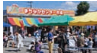
Opening of Machinaka Center Market

Machinaka Center Market opened in Shibukawa Navel Square to stimulate the economy in the downtown area and create a stable market base to sell fresh produce, seafood and meat.