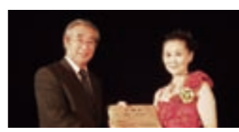
Shibukawa Tourism Ambassadors

In order to promote its abundant tourism resources, the city has asked many notable public figures associated with Shibukawa City to act as tourism ambassadors. They include opera singer Kazue Morinaga, enka (Japanese ballad) singer Hiromasa Shimizu, broadcaster Yuri Osawa and kimono designer Nobuaki Tomita.