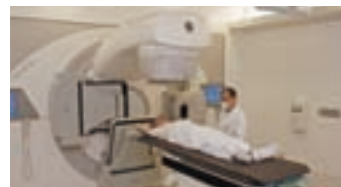
Introduction of Liniac to Shibukawa Sogo Hospital

Liniac, which is a state-of-the-art high accuracy radiotherapy device for treating cancer, has been introduced to Shibukawa Sogo Hospital. The unit delivers high doses of radiation to the lesion from various angles. Since the side effects are extremely rare, the stress level on the patients is significantly reduced.