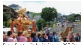
Extending the Ikaho Ishidan to 365 Steps

Now that the stone steps that are symbolic of Ikaho have increased to 365 steps, people can view them from Prefectural Route Shibukawa-matsuida. Elementary and junior high school students performed at the ceremony to commemorate the extension. When they came down the shrine carrying the mikoshi (ornately-decorated carriage that symbolically houses a deity), a cheer rose from the crowd.