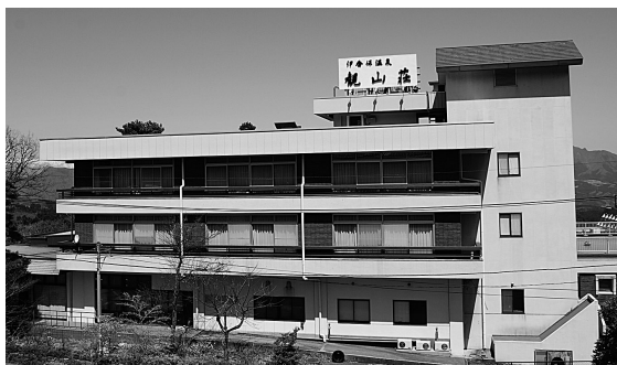
取得し解体される観山荘