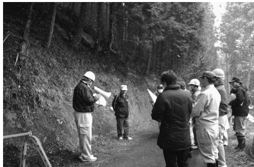
小野上地区道路陥没現場