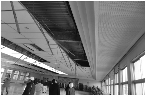
子持中学校食堂天井落下

17日及び18日は、常任委員会や各会派による調査並びに議案審査に充てられました。