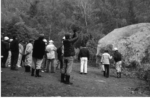
棚下不動の巨大落石