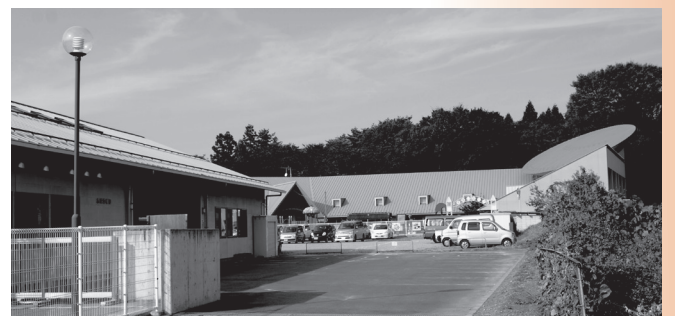
併設する赤城幼稚園とひばり保育園