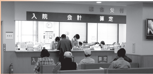
渋川総合病院受付窓口