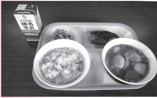
おいしい学校給食