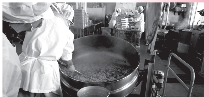
給食調理場作業風景