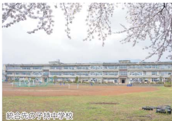
統合先の子持中学校