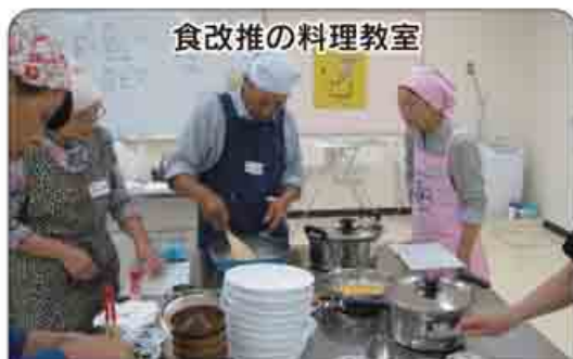
食改推の料理教室

今年度、市が実施している特定健診など(国保特定健診、後期高齢者健診、胃がん検診、大腸がん検診、前立腺がん検診、胃がんリスク検診)の集団健(検)診は、11月の日程で終了となります(下表参照)。各地区で受診できなかった人は、都合の良い日に受診してください。 ※国保特定健診と後期高齢者健診は、11月30日(月)まで指定医療機関で受診することもできます。