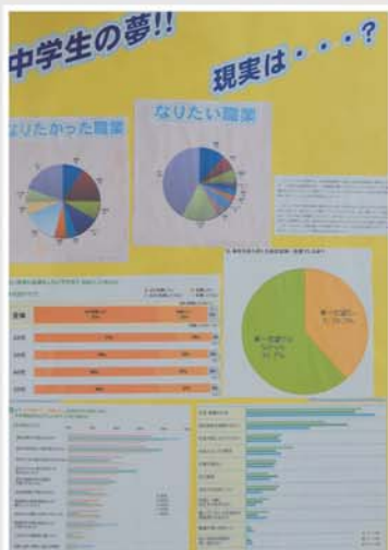
統計グラフコンクール (パソコン統計グラフの部最優秀作品)