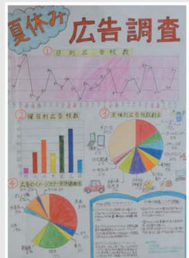
統計グラフコンクール (第3部最優秀作品)