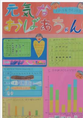
統計グラフコンクール 〈第1部最優秀作品〉