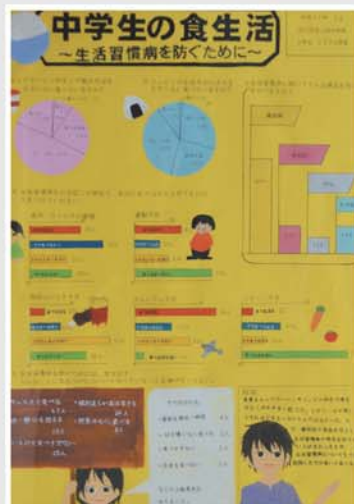
統計グラフコンクール (第4部最優秀作品)