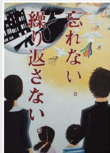
平和推進啓発ポスター 〈最優秀作品〉