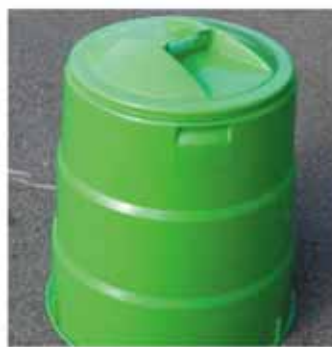
生ごみ堆肥化容器

する補助制度 生ごみ処理機(堆肥化処理容器、EM菌容器、電動処理機) 、枝葉破砕機を購入した人に補助金を交付しています。購入を考えている人は、環境課へ相談してください。