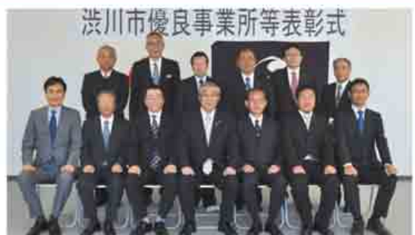
表彰を受けた企業の皆さん