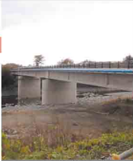
子持地区と赤城地区を結ぶ建設中の橋田川