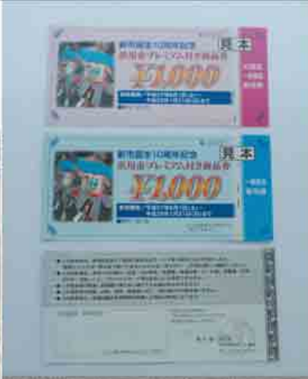
3万2,000セット販売されたプレミアム付き商品券