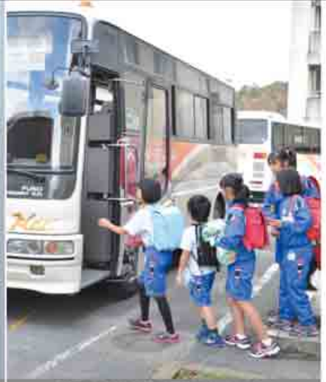
利用者負担が無料になった通学バス