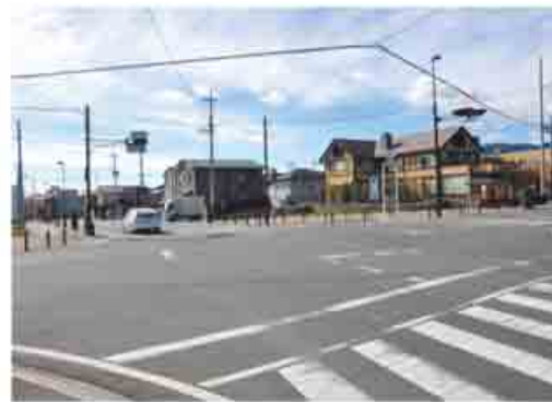
現在の四ツ角周辺の様子