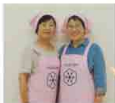
赤城・伊香保地区食改推の 皆さん