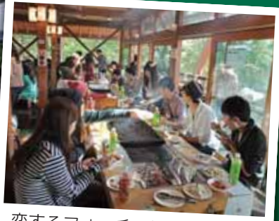
恋するフォーチュンクッキング