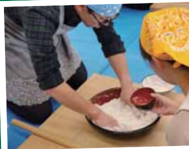
そば打ち婚活交流会