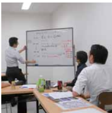
チームによる企画会議

また、庁内若手職員が「恋活プロジェクトチーム」を立ち上げるなど、恋活を積極的に応援しています。プロジェクトチームは、