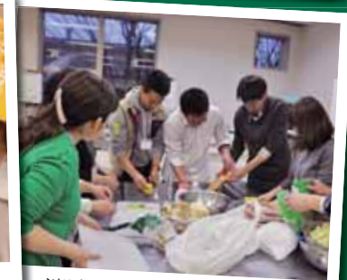
消防士さんと鍋パーティー