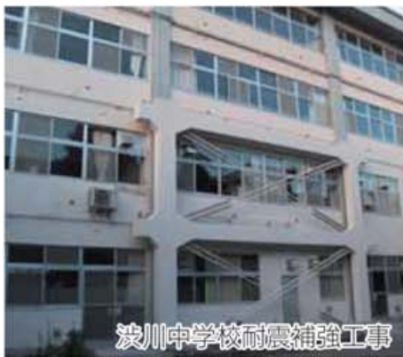
渋川中学校耐震補強工事

渋川市耐震改修促進計画では、27年度までに市有建築物の耐震化率を9割にすることを目標としています。公共施設等の平常時の安全だけでなく、災害時の拠点施設としての機能確保