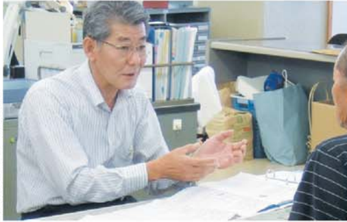
「説明をする市政相談員」