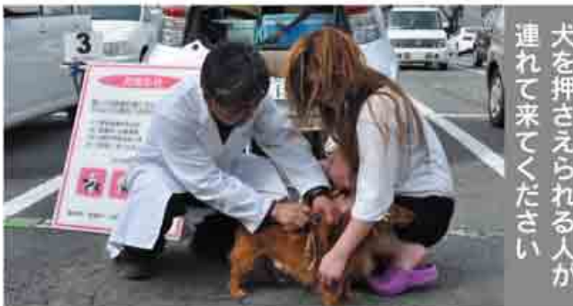
犬を押さえられる人が連れて来てください