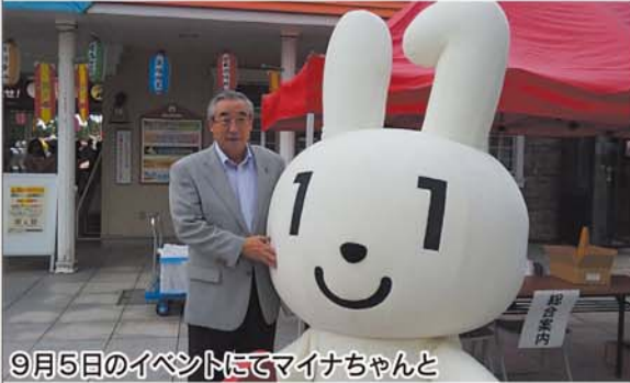
9月5日のイベントにてマイナちゃんと