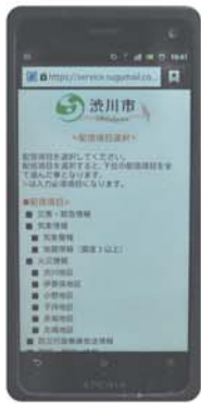
渋川ほっとマップメールで配信する情報