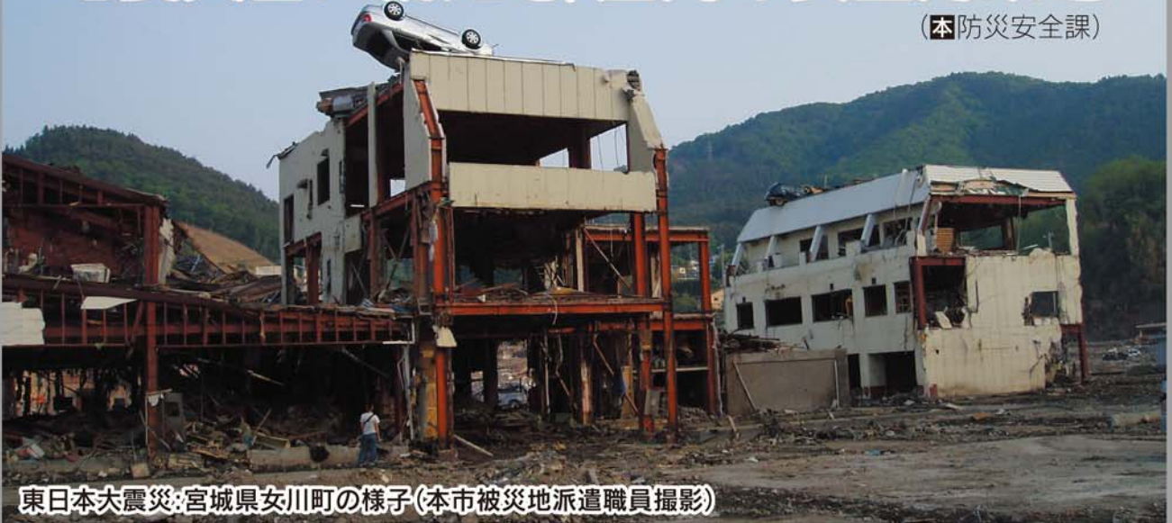
東日本大震災:宮城県女川町の様子(本市被災地派遣職員撮影)

2011年春。日本列島は最大級の地震に襲われました。その余震と影響はいまだ完全には収束せず、次なる脅威、首都直下型地震や東海地震などが間近に迫っているとも言われています。