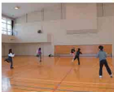
伊香保体育館の様子