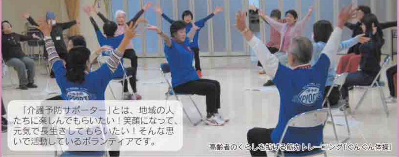
高齢者のくらしを拓ける筋力トレーニング「ぐんぐん体操」

「介護予防サポーター」とは、地域の人たちに楽しんでもらいたい！笑顔になって、元気で長生きしてもらいたい！そんな思いで活動しているボランティアです。