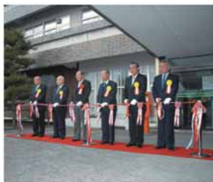
平成18年開庁式の様子

北中学校吹奏楽部の演奏・渋川市10年のあゆみ上映(写真スライド) ▽第二部記念式典(午前10時30分) ▽感謝状贈呈・新市誕生10周年記念作文表彰、最優秀作文の発表など 駐車場 市役所本庁舎・第二庁舎をご利用ください(シャトルバスを運行します) 問い合わせ先 本企画課(☎2396・FAX246541)