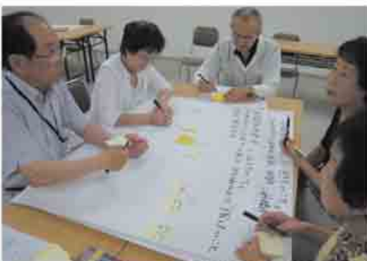
サポーター同士で活発な意見交換