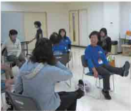
熱心に体操のコツを伝えます

市内13会場で行う筋力向上教室「シニア筋力ぐんぐん教室」では、介護予防サポーターが中心となり、高齢者の暮らしを拓けるトレーニングを行っています。「歩くのが楽になった」などの声を聴き、サポーター自身も元気になります。