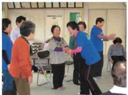
身近な会場で教室を開催(津久田第三集会所)

自治会などにご理解をいただき、歩いて通える身近な会場で運動やレクを行う教室を自主的に開催しています。また、サロンや老人クラブなどにも出向いています。