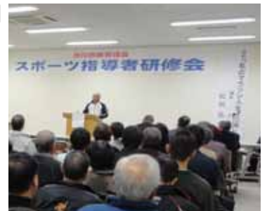
昨年の研修会の様子

一歩・障害者団体など 対象事業 対象団体が歳末 または正月時期に自主的に 企画・実施する交流事業 助成額 2万円(上限) 申請方法 申請書(市社会福 祉協議会本所および各支所 にあります)に必要事項を記 入し、事業実施前に申請書 配布窓口へ提出 申請期限 12月16日(月)