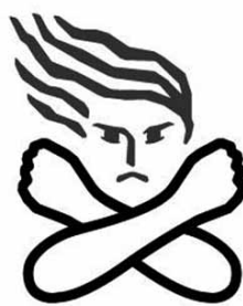
女性に対する暴力根絶のシンボルマーク

女性に対する暴力をなくす運動とは？ 配偶者等からの暴力(DV)、性犯罪や売買春、ストーカー行為など。これらの女性に対する暴力は、女性の人権を著しく侵害するものであり、男女共同参