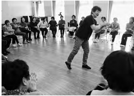
研修を受けてサポーターの仲間入りを!