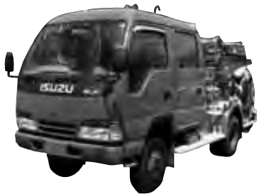
写真上から議長車(トヨタクラウン)、消防団ポンプ車2台(いすゞエルフ・21分団使用車と24分団使用車)

市の公用車3台を、一般競争入札により売却します。入札参加希望者は、申し込みください。なお、入札申込期間中に、売却する自動車を開し、入札説明書を配布します。 入札日 8月2日(金)午後1時30分 ところ 市役所西棟入札室 対象車両・初度登録年月・走行距離・最低売却価格 ▽議長車(トヨタクラウン) 平成8年4月登録・12万7524 キロメートル ・50000円 ▽消防団ポンプ車(いすゞエルフ・21分団使用車)・平成8年1月登録・9767 キロメートル ・16万円 ▽消防団ポンプ車(いすゞエルフ・24分団使用車)・平成6年9月登録・7144 キロメートル ・10万円 車両公開場所 市役所本庁舎駐車場 入札説明書配布場所 本財政課 入札参加資格 今年7月15日現在で本市に住居登録している人、または市内に本社か営業所を置き、事業活動を行う法人 申込・問い合わせ先 申込用紙(財政課にあります)に記入し、財政課(☎2414)へ 申込期間 7月29日(月)～8月1日(木)