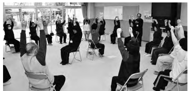
(別表) 8月のシニア筋力ぐんぐん教室日程