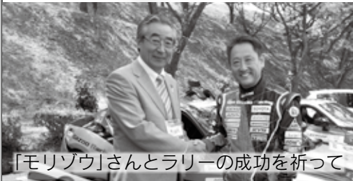
「モリゾウ」とラリーの成功を祈って

昨年に引き続き開催された、全日本ラリー選手権第5戦(モントレール2013in群馬)は、トヨタのラリーチャレンジが併催され、2日間で2万6,000人のギャラリーに足を運んでいただきました。