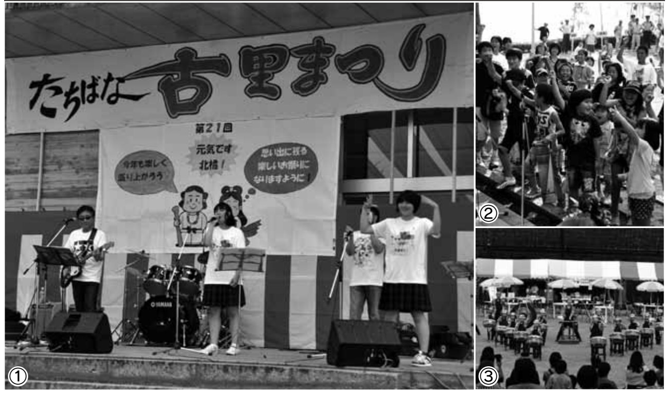
①ステージでの熱演。曲はAK B48「ヘビーローテーション」 ②抽選会での1コマ ③子どもたちによる和太鼓の演奏