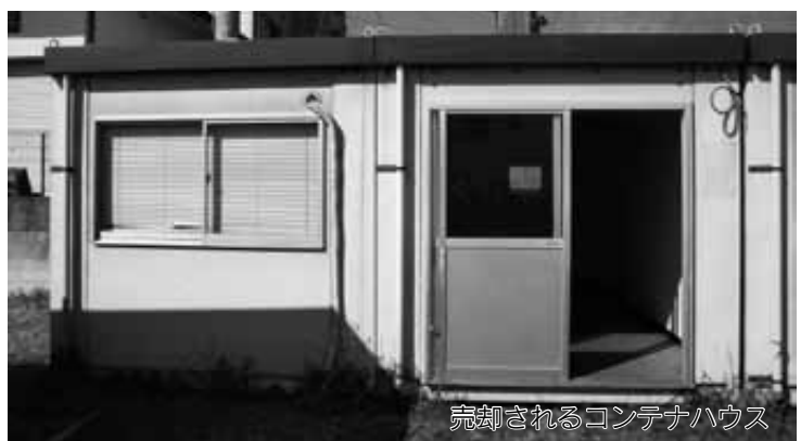
売却されるコンテナハウス