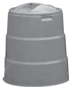
購入したら申請を

①生ごみ堆肥化処理容器(土 中)に容器を埋める土壌微生物の分解による方式) Ⅱ上限3000円(1世帯2台まで) ②微生物による処理容器(密閉容器を利用する特殊な微生物の分解による方式) Ⅱ上限2000円(1世帯2台まで、微生物菌は2袋まで) ③電動式生ごみ処理機(電動による微生物分解または乾燥方式) Ⅱ上限2万円(1世帯1台まで) ④枝葉破砕機(一般家庭用の電気式機械) Ⅱ上限2万円(1世帯1台まで)