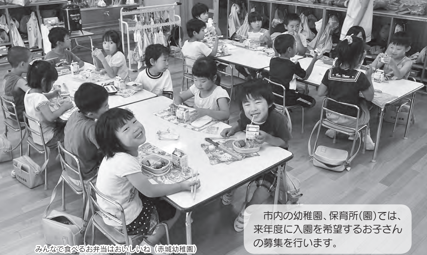
みんなで食べるお弁当はおいしいね (赤城幼稚園)

市内の幼稚園、保育所(園)では、来年度に入園を希望するお子さんの募集を行います。