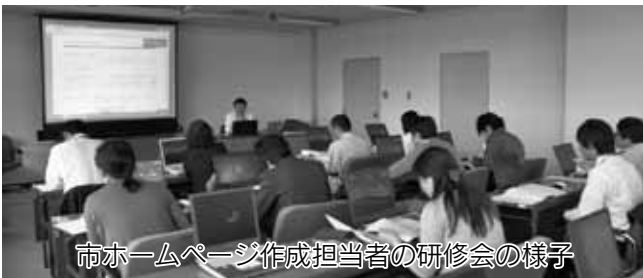
市ホームページ作成担当者の研修会の様子