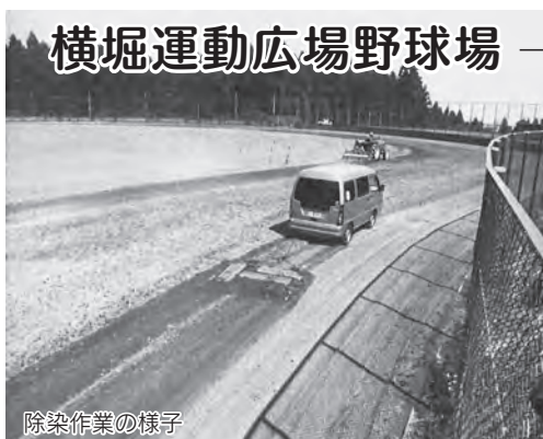
横堀運動広場野球場