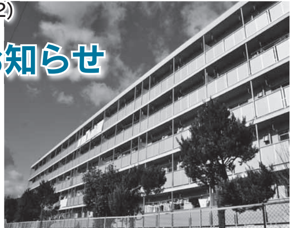
(別表1) 市営住宅などの入居者募集物件一覧