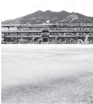
子持中学校の校庭

なお、子持中学校の校庭については、国史跡である黒井峯遺跡の指定範囲内にあるため、掘削などの行為には制限があり、文化庁長官の許可が必要です。そのため、早急に手立てをすることができません。校庭整備につきましても、県教育委員会を通じて文化庁の指導を受けながら、実施に向けて検討を行っていきたいと考えています。 (教育総務課)