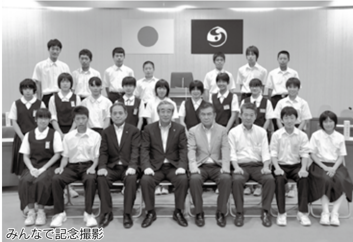
みんなで記念撮影