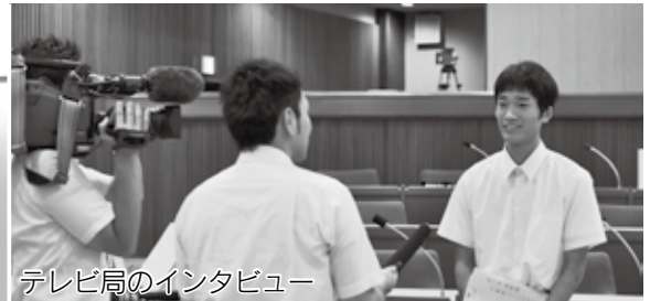
テレビ局のインタビュー