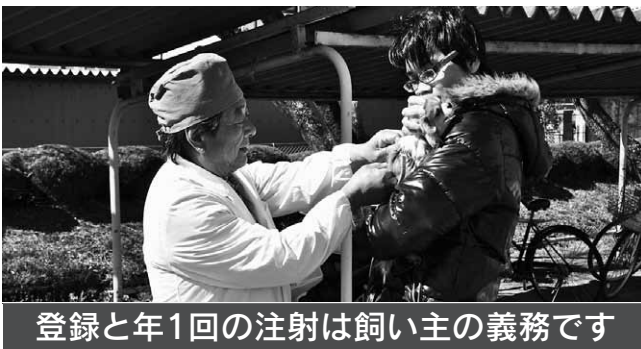
登録と年1回の注射は飼い主の義務です