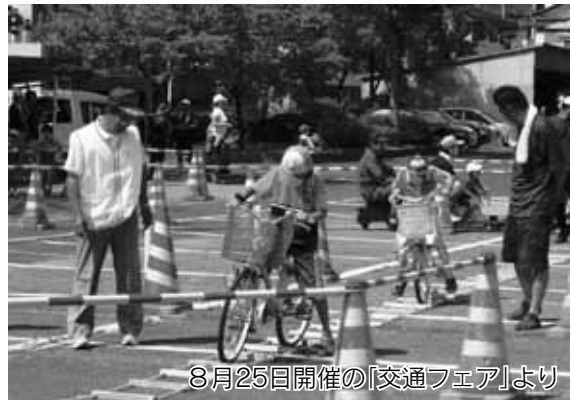
8月25日開催の「交通フェア」より