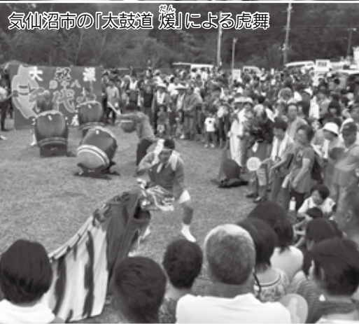
気仙沼市の「太鼓道 たかみち 媛」による虎舞