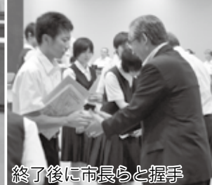
終了後に市長らと握手