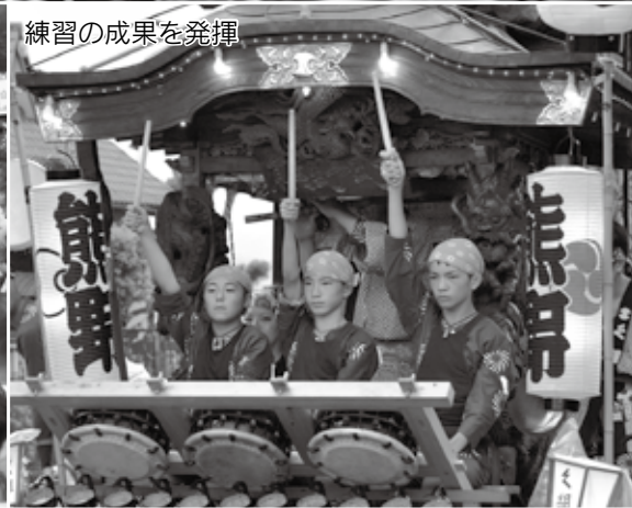
練習の成果を発揮