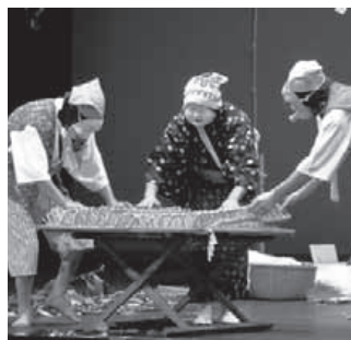
「養蚕の舞」での一場面

時 10月6日(土) 午後2時開演 所 北橘歴史資料館前の歴史公園(北橘町真壁)